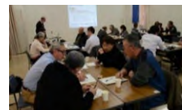
農山漁村の多様な活動への参加