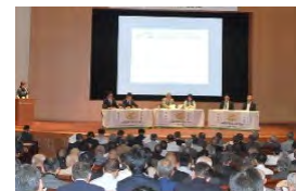
農業農村の多様な価値の理解醸成