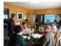
地域の活動計画の策定 （ワークショップの開催）

※条件不利地においては、交付期間の延長・上限額の加算措置あり。また、専門的スキルを活用する場合には、交付期間の延長・上限額の加算措置あり。