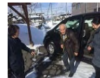
体制構築及び実証活動 （高齢者の移動確保）