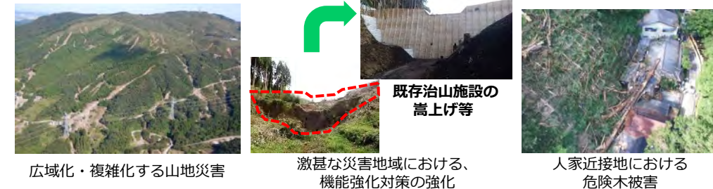
広域化・複雑化する山地災害