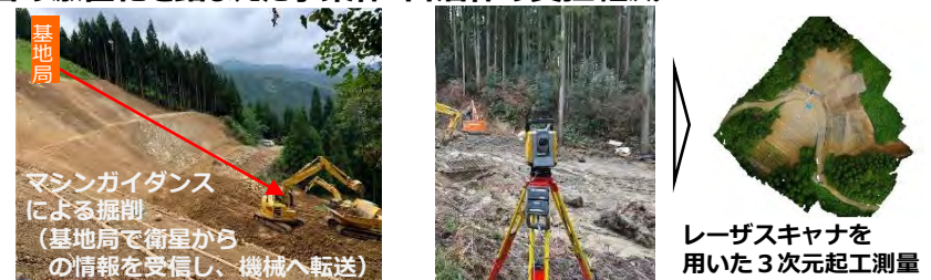
ICT等新技術の導入による施工の効率化や精度向上