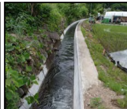
老朽化した用水路の整備・更新