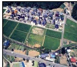
ほ場整備による農業生産性の向上と秩序ある土地利用の推進