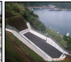
漁村における津波避難対策のための津波避難対策（避難地、避難路の整備）