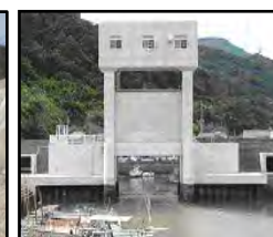
津波・高潮対策としての水門整備

（共通）切迫する南海トラフ地震、日本海溝・千島海溝周辺海溝型地震等の発生を見据えた防災インフラ整備