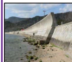
津波、高潮による被害を未然に防ぐため海岸堤防の整備を推進