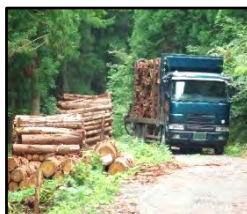
林道等の整備により効率的な間伐材等の搬出を実現