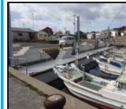
漁業作業の効率化と安全対策のための漁港整備（岸壁改良）