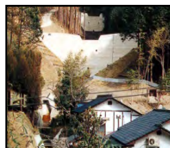
治山施設による山地災害の未然防止