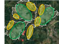
【土地利用構想の概定】