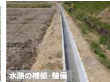
水路の補修・整備