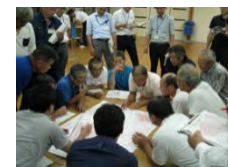
【地域ぐるみでの話し合い】

Step 1 地域ぐるみの話し合いにより、営農を続けて守るべき農地、粗放的な利用を行う農地等を区分し、実証的な取組を実施