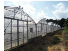
【農業用ハウスの整備】