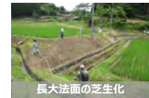
長大法面の芝生化