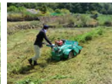
【省力化機械の導入】