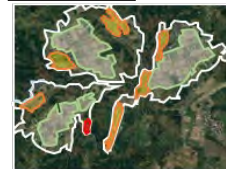
【土地利用構想図の策定】

Step 2 土地利用構想図を策定し、農用地保全のための条件整備や各種取組を選択・実施