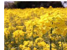
【蜜源作物の作付け】