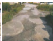
農道の窪みの補修