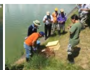
ため池の外來種駆除

実施主体：農業者等で構成される組織（①及び③は農業者のみで構成する組織でも取組可能） 対象農用地：農振農用地及び多面的機能の発揮の観点から都道府県知事が定める農用地