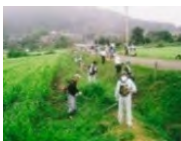
農地法面の草刈り