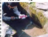
水路のひび割れ補修