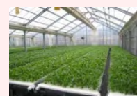
農業生産施設（水耕栽培ハウス）