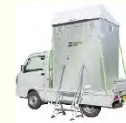
移動式トイレの導入