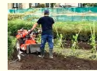
ユニバーサル農園の運用