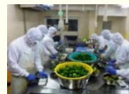
農産加工の実践研修