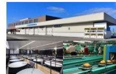
集出荷・貯蔵・加工施設