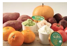
農産物を利用した新商品開発