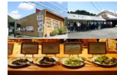
地元食材を使用したレストラン