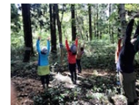
森林を利用したヒーリング事業