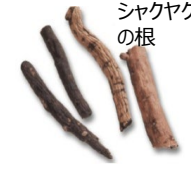
《薬用作物と林産物の複合経営》