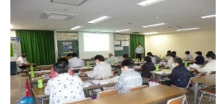
《農薬使用に関する研修会》