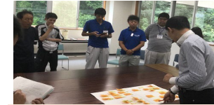
《専門家を招いたワークショップ》