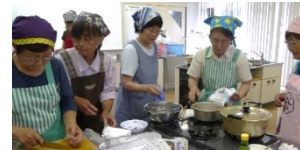
《新メニュー開発の講習会》