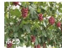
《野菜と果樹の複合経営》