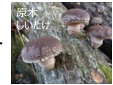
《薬用作物と林産物の複合経営》