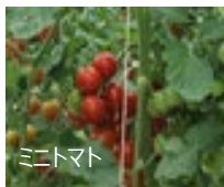
《野菜と果樹の複合経営》