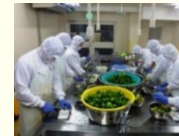
農産加工の実践研修