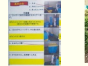
ユニバーサル農園の運用