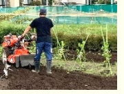
ユニバーサル農園の運用

※ 将来の農業現場での雇用・就労を見据え、多世代・多属性の者が利用できる体験農園