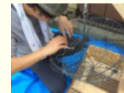
養殖籠補修・木工技術習得