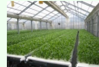
農業生産施設（水耕栽培ハウス）